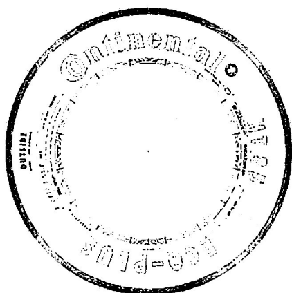
Obr. č.1 - staré značení